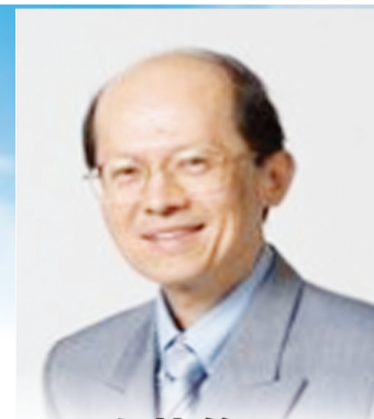
新加坡陈英俊医生供稿